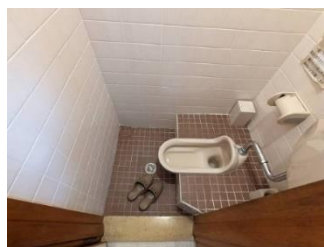
トイレ手前に手洗いスペースがあり、トイレはとても狭く使いにくい和式でした

いつもお世話になっている会社の社長さんより、事務所のトイレ改修工事をご依頼頂きました。中古で買った物件はトイレの水道管が壊れていて二つのトイレが使えない状態でした。しかし他に使えるトイレがあったのでそのままにしましたが、この度「事務所入り口にあるトイレを使えるようにする事は、社員さんやお客様の為にもなる」と社長さんは決心しました。色柄などの仕上げは社員さんの声も聞きながらリフォームさせて頂きました。