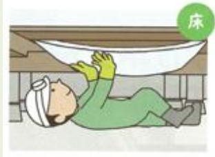
点検口から床下に入り床に断熱材を貼る 工期：半日～