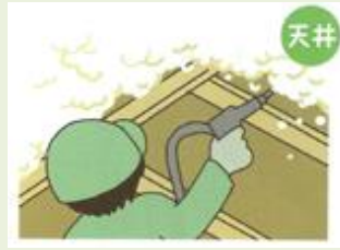
点検口から小屋裏に入り天井に断熱材を吹き付ける 工期：半日～