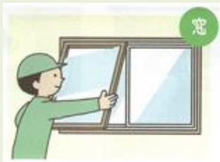
内窓をつける 工期：1時間～