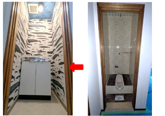
クジラやイルカが泳ぐ壁紙と、天井は蓄光タイプの夜空に星が輝くような壁紙です。社員さんは、『ここにいる時間が長くなりそうです!』と笑顔一杯でした。

こちらのトイレも水道管のトラブルで使えなくなっていました。こちらはトイレで必要がないとの判断で、給湯室にしました。遊び心のある大胆な壁紙で、毎日忙しく働く社員さんもおっと一息つけるような空間になりました。今はいろいろな壁紙があるので、トイレや洗面室など小さな空間から遊んでみると楽しいですよ。