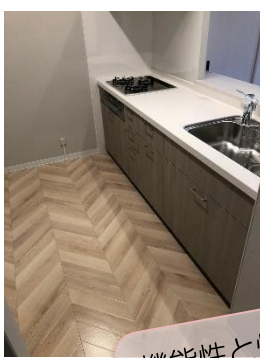
機能性と快適性を高めたフルリフォームめっちゃかわいいです♪

ガーデンヒルズ今池貳番館 102号室 安城市今池町3丁目583番地3 3LDK(71.31㎡・壁芯) 専用庭あり 敷地内駐車場1台確保 販売価格 2,620万円(消費税込)