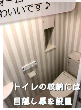
トイレの収納には目隠し扉を設置