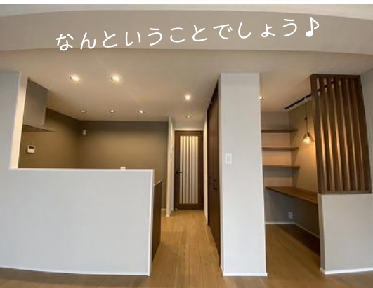
なんということでしょう♪