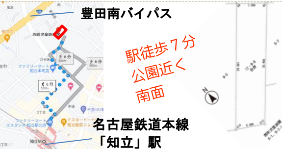
駅徒歩7分 公園近く 南面

2,805万円 201.65㎡ (60.99坪) 物件所在地：知立市西町西12番・9番6合併 都市計画：市街化区域 地目：宅地 建蔽率：80% 容積率：200% 取引：仲介 現況：更地 現況渡し 建築条件なし