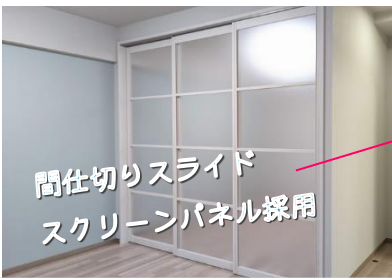
間仕切りスライドスクリーンパネル採用

ガーデンヒルズ今池貳番館 102号室 安城市今池町3丁目583番地3 3LDK(71.31㎡・壁芯) 専用庭あり 敷地内駐車場1台確保 販売価格 2,620万円(消費税込)