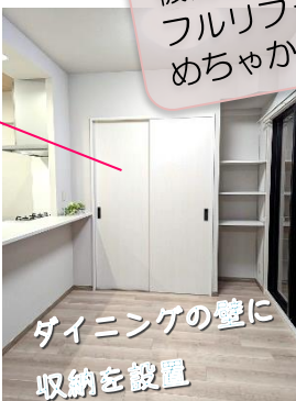
ダイニングの壁に収納を設置