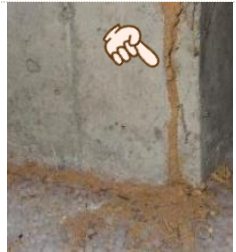
壁に作られた蟻道