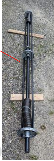
手動シャッターの開閉器「スプリングシャフト」バネの力で凄いですね！